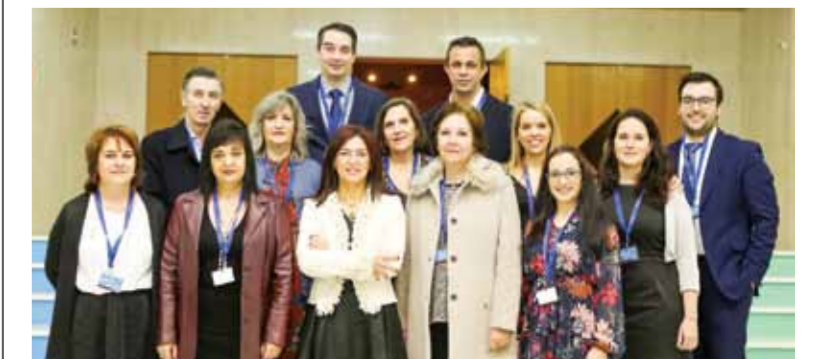
Elementos da Comissão Organizadora do Encontro

Quanto à motivação das pessoas, “o capital mais precioso nas organizações”, a enfermeira diretora do CHUC referiu alguns fatores co-