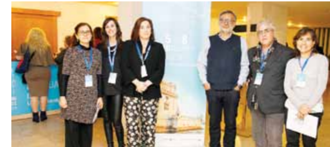
Elementos da Comissão Organizadora