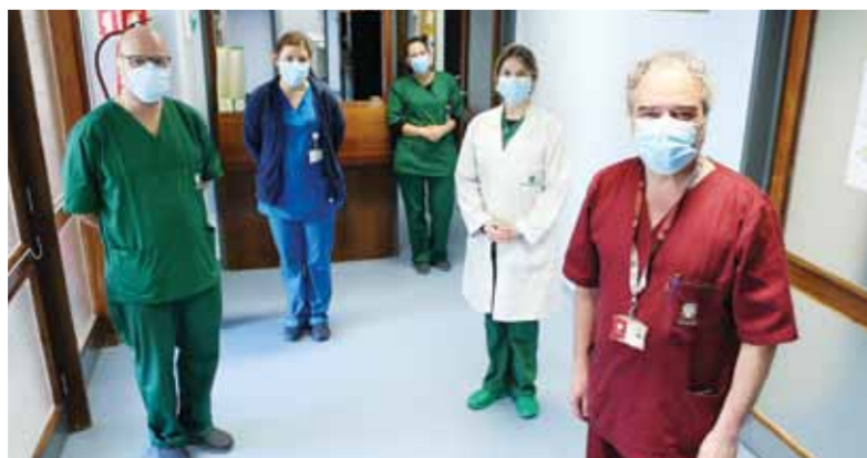
O Serviço de Psicologia trabalha em estreita colaboração com os elementos dos Cuidados Paliativos no apoio a doentes e familiares/cuidadores

“Os níveis de intervenção na covid-19 estão a aumentar e nós vamos alargar este apoio a todos os profissionais que estejam mais diretamente envolvidos, que serão em número superior a 500. Uma coisa que temos procurado fazer é dar algum suporte a quem, de um momento para o outro, por necessidade de recursos, é deslocado do seu serviço para lidar com doentes com covid-19. Isto cria um impacto muito forte e também