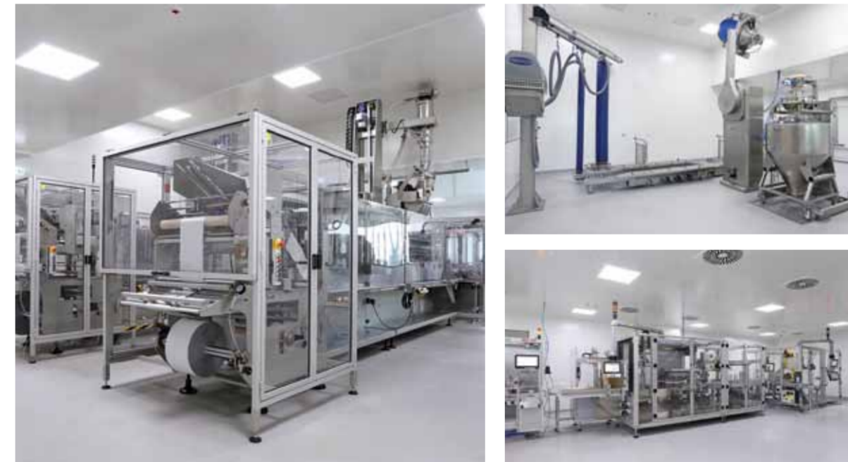
A Vifor Pharma inaugurou recentemente uma nova fábrica em Portugal

A Vifor Pharma, através do seu Departamento de Investigação e Desenvolvimento Clínico, já há vários anos tem vindo a apostar na área cardiorenal. Vai agora lançar em Portugal o Veltassa® (patirómero), aprovado pela FDA em 2015 e pela EMA em 2017. É um novo captador de potássio para o tratamento da hipercaliemia. O programa de desenvolvimento clínico, que inclui os ensaios clínicos OPAL-HK, AMETHYST-DN, PEARL-HF, TOURMALINE e AMBER, mostrou que o patirómero foi eficaz tanto na redução como na manutenção da concentração de potássio sérico. Trata-se de um fármaco bem tolerado e com baixa incidência de efeitos adversos.