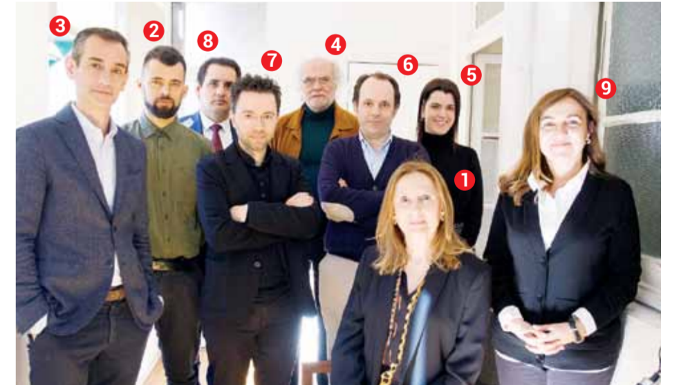
Corpos Sociais da SPPSM – Triénio 2020-2022

Garantiu também: “Vamos dar o nosso melhor pelo conhecimento científico, pelos psiquiatras, pelos outros profissionais de Saúde Mental e, acima de tudo, pelos doentes, famílias e comunidades mais alargadas onde estão inseridos.”