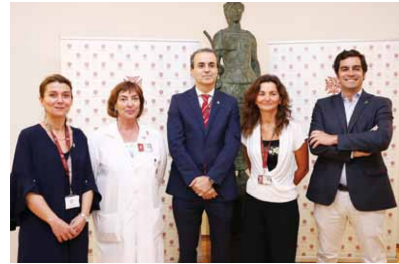
O atual CA iniciou funções, oficialmente, a 5 de abril de 2019

EA – Se não tivermos mecanismos que possam, de alguma forma, estimular os profissionais haverá, com certeza, mais dificuldade em os reter. Mas eles não ficam só pela parte económica, precisam de um